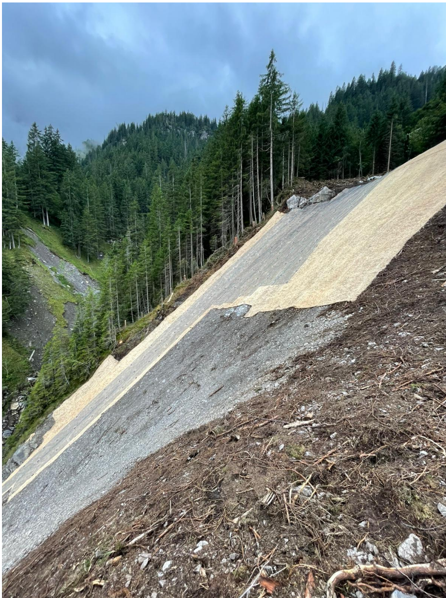
Abbildung: Hangsicherung im Kiental mit einem Holzwoollvlies, Geotextil un Ansaat.

Für die Burgerbäuert Faulensee übernahmen wir die Planung und Durchführung des jährlichen Holzeinschlags im Seeholzwald. Zudem konnten wir im Kiental eine grössere Hangverbauung realisieren. Unsere Spezialisten im Bereich Seil- und Tiefbau verlegten innert kurzer Zeit Holzwoollvlies und sicherten exponierte Bereiche zusätzlich mit Geotextil. Anschliessend wurde die Fläche angesät, damit eine rasche Begrünung erfolgt und die Erosion langfristig eingedämmt wird.