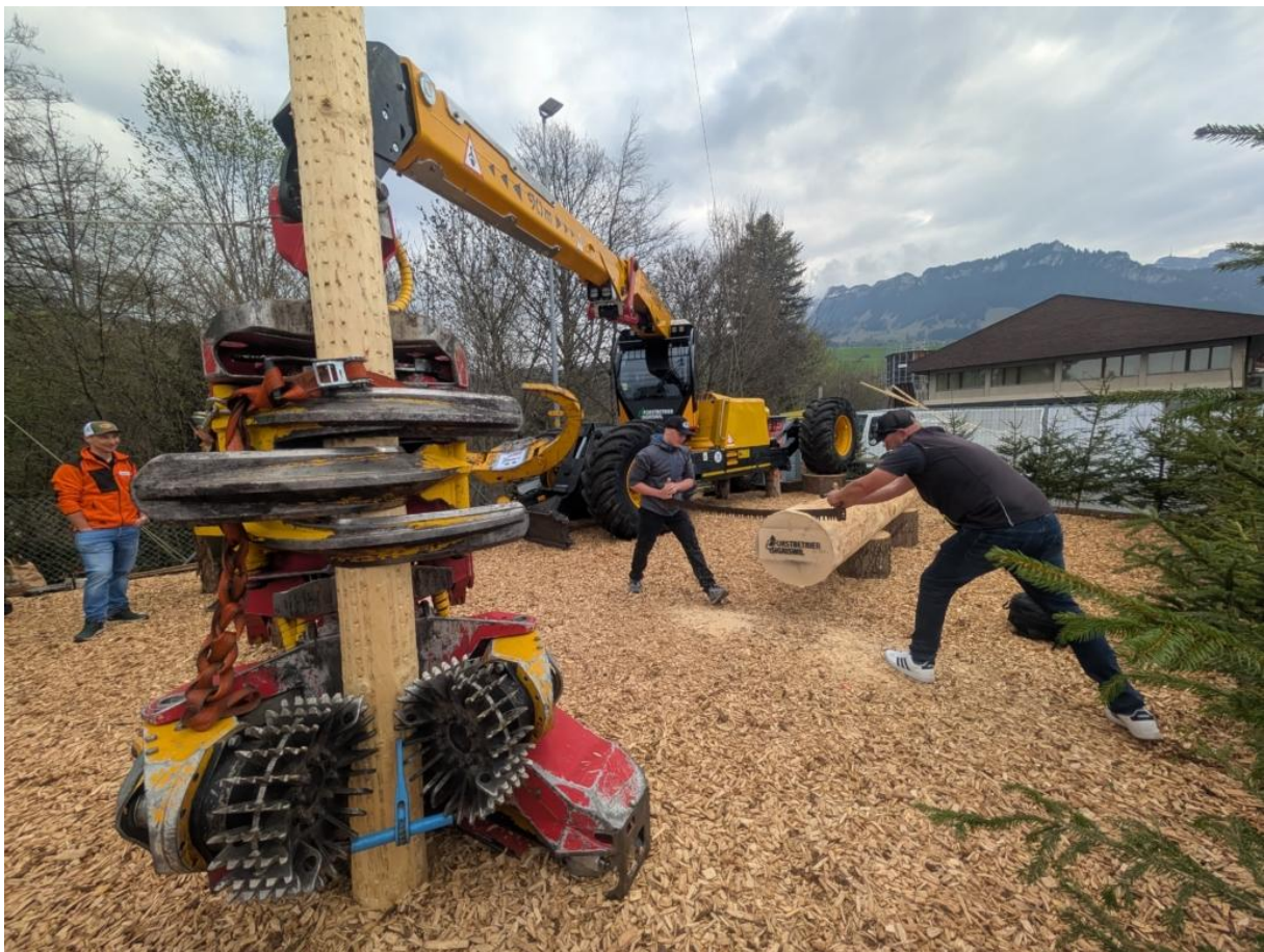
Abbildung: Zwei Besucher sägen an unserem Stand mit der Hobelzahnsäge eine Holzscheibe ab, bevor sie sich anschliessend an der Bar mit einem wohlverdienten Getränk stärken.

An der betriebseigenen Bar bot sich Gelegenheit, den Durst zu stillen und in ungezwungener Atmosphäre Gespräche über Wald, Holz und weitere Themen zu führen.