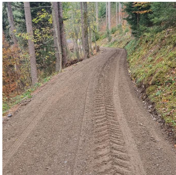
Abbildung: Fertig profilierte Strasse, bereit zum Verdichten.