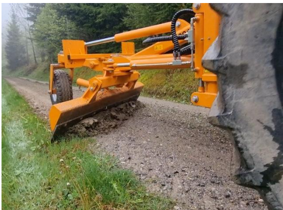
Abbildung: Funktionsweise des R2 Geräts

Bei der hochfrequenten Pflege wassergebundener Forststrassen soll die technische Funktionalität der Wege durch mehrere Pflegedurchgänge pro Jahr dauerhaft erhalten bleiben. Dabei wird durch Nutzung und Erosion verlorengehendes Material aus der Deckschicht gesichert und kontinuierlich auf den Wegekörper zurückgeführt. So bleibt der Wegekörper geschlossen, und der Weg ist auch unmittelbar nach einem Pflegedurchgang nutzbar. Gleichzeitig werden Materialzugaben und periodische Unterhaltsmassnahmen minimiert. Um diesen Unterhalt technisch sicherzustellen, nahm der Forstbetrieb Sigriswil im Mai 2025 ein Wegepflegegerät R2 des bayerischen Herstellers Bräu & Niebauer in Betrieb. Bereits im ersten Einsatzjahr wurden die Forststrassen mehrfach damit gepflegt; die Ergebnisse entsprechen den Zielen des Unterhaltskonzepts. Das Projekt wird von der HAFL begleitet.