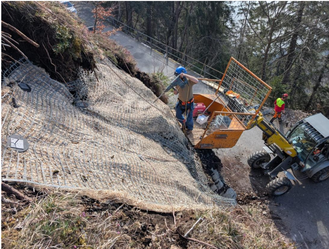
Abbildung: Bauprofi Christian Mischer beim Bohren der Sicherungsanker im Rahmen der Hangsicherung.

Zusätzlich wurde eine instabile Fläche oberhalb der Grönstrasse nachhaltig gesichert. Mittels Holzwollvliesen, Geotextilnetz und Ansaat konnte die Erosionsanfälligkeit reduziert und die Hangstabilität verbessert werden.