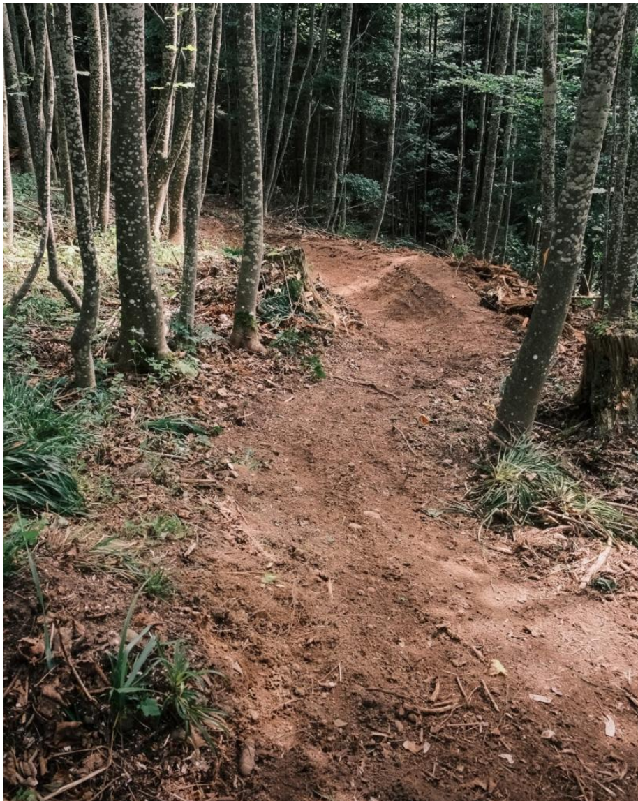
Abbildung: Der neu erstellte Flowtrail im Gebiet Blumen bietet abwechslungsreichen Fahrspass und richtet sich an Bikerinnen und Biker aller Alters- und Könnertufen.

Der Trail konnte plangemäss erstellt und im Oktober 2025 offiziell eröffnet werden. Mit dem neuen Angebot wird die touristische Infrastruktur gezielt ergänzt und sowohl der einheimischen Bevölkerung als auch Gästen eine attraktive Freizeitmöglichkeit geboten.