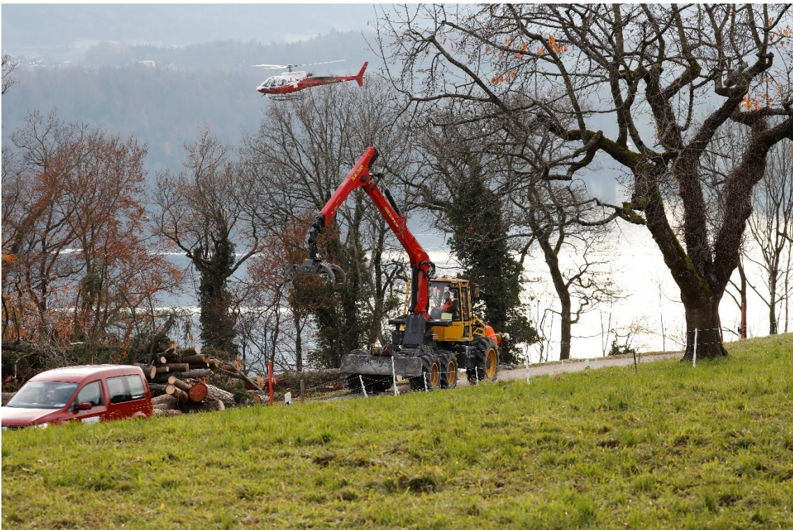
Abbildung: In unwegsamem Gelände erfolgt die Schutzwaldpflege wie hier oberhalb von Guten mit dem Helikopter.

Darüber hinaus war der Forstbetrieb für die Umsetzung der Mehrjahresplanung im Schutzwald in den Gemeinden Oberhofen und Hilterfingen verantwortlich. Zusätzlich übernahm der Forstbetrieb die Projektleitung für ein grösseres Einzelprojekt in der Gemeinde Stocken-Höfen, welches durch einen Forstunternehmer ausgeführt wurde.