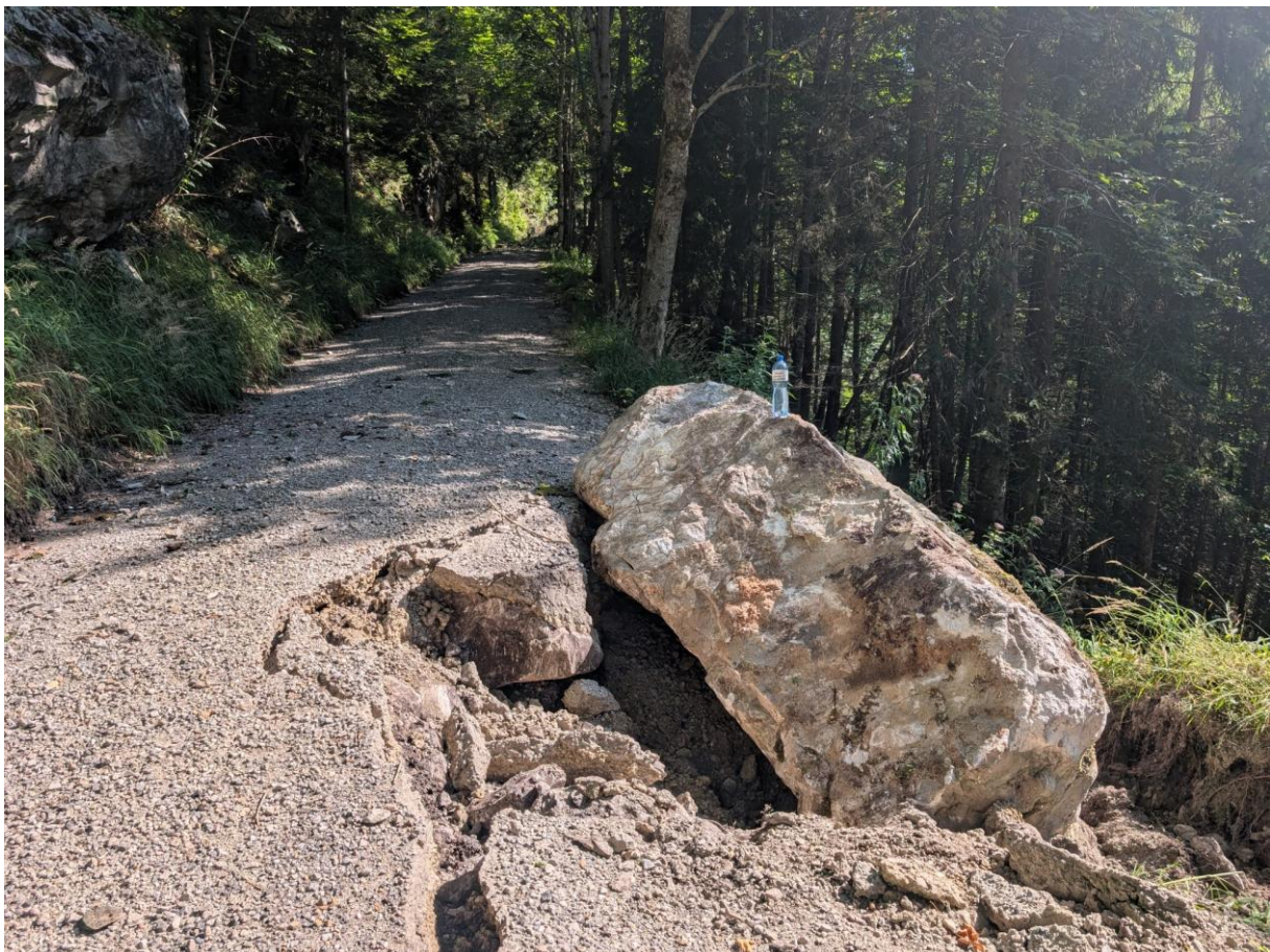
Abbildung: Der oberhalb der Grönstrasse niedergegangene Felsblock, der die Forststrasse erreichte und eine umgehende Instandstellung erforderlich machte.

Ungeachtet der aktuell geringeren Aktivität bleibt eine kontinuierliche Beobachtung der Messgebiete unerlässlich. Die systematische Überwachung wird deshalb weitergeführt, um allfällige Veränderungen frühzeitig zu erkennen und bei Bedarf rechtzeitig geeignete Massnahmen einzuleiten.