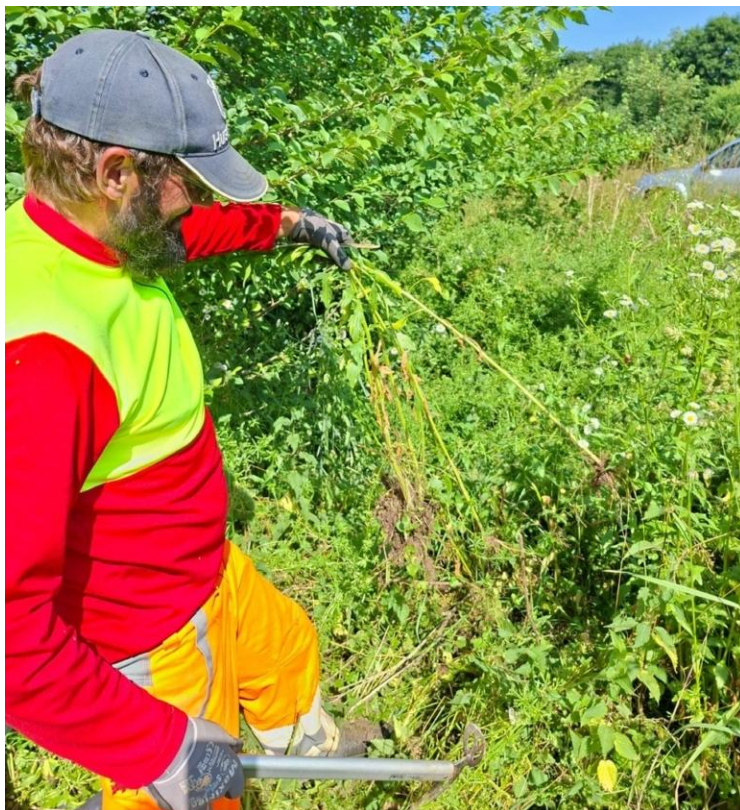
Die Bekämpfung des Einjährigen Berufkrauts ist aufwändige Handarbeit. Für eine nachhaltige Eindämmung muss die Pflanze mitsamt dem gesamten Wurzelwerk sorgfältig entfernt werden.

Ergänzend zu den betrieblichen Massnahmen wurde auch die Bevölkerung aktiv einbezogen. Private Grundeigentümerinnen und -eigentümer wurden dazu aufgerufen, invasive Arten frühzeitig auf ihren Grundstücken zu entfernen. Erfreulicherweise engagierten sich zudem freiwillige Helferinnen und Helfer bei der Bekämpfung auf Privatflächen und leisteten damit einen wertvollen Beitrag zur Eindämmung der Problempflanzen. Dieses gemeinsame Engagement von Forstbetrieb, Gemeinde und Bevölkerung ist entscheidend, um die Ausbreitung langfristig unter Kontrolle zu halten und den Aufwand in einem tragbaren Rahmen zu sichern.