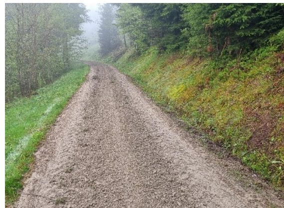
Abbildung: frisch gepflegter Strassenabschnitt