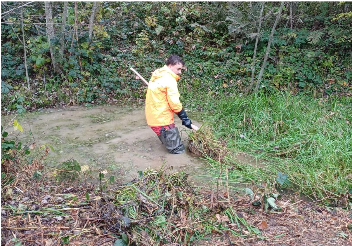
Abbildung: Aaron Grossglauser, ausgerüstet mit Heizsocken und hohen Fischerstiefeln, bei der Pflege der Weiher im Hubelgebiet. Durch das Entfernen des starken Bewuchses wird die ökologische Funktion der Gewässer langfristig gesichert.

Das Forstpersonal führte gezielte Pflege- und Aufwertungsmassnahmen zur Förderung der Biodiversität auf einer Fläche von 4.00 Hektar durch. Dazu gehörten unter anderem Freistellungen von Lebensräumen, die Pflege von Orchideenstandorten, Unterhalt von Weihern sowie die strukturreiche Gestaltung von Waldrändern. Die umgesetzten Arbeiten wurden im Umfang von CHF 34'100.- mit dem AWN abgerechnet und leisten einen wichtigen Beitrag zur Erhaltung und Förderung seltener Tier- und Pflanzenarten in der Region.