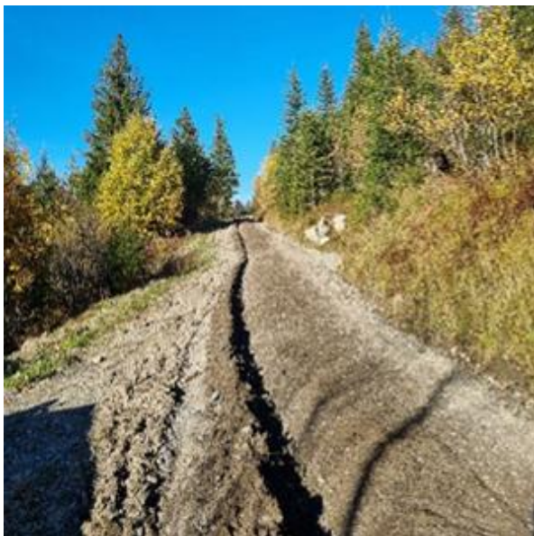
Abbildung: Material ab Zettenalp (0 – 150) vorgebrochen auf 0 – 50, bereit zum nachbrechen.